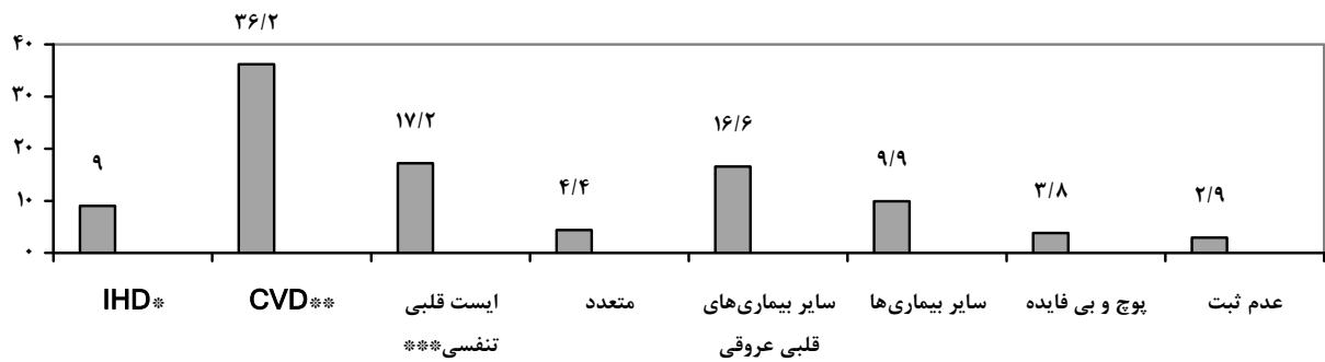
نمودار ۱ - درصد فراوانی علل مستقیم مرگ ثبت شده در گواهی فوت

Ischaemic heart disease* Cerebrovascular Disease**