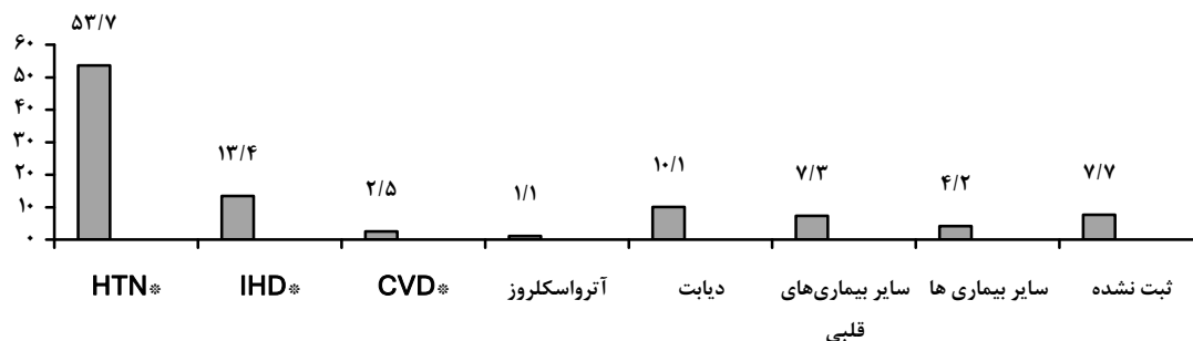
نمودار ۴ - درصد فراوانی علل زمینه‌ای مرگ طبق پرونده پزشکی بیمار

Hypertention * Ischaemic heart disease ** Cerebrovascular Disease ***